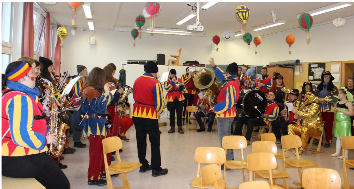
Text und Bilder: M. Müller