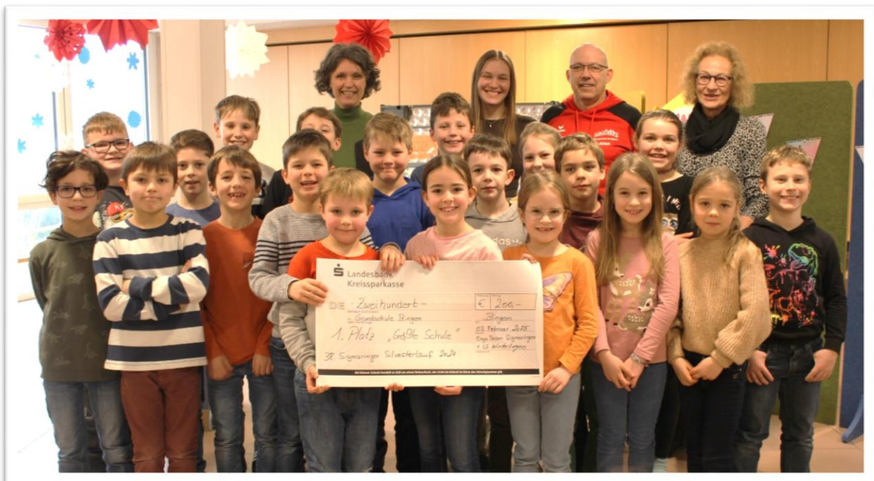
Text: M.Müller