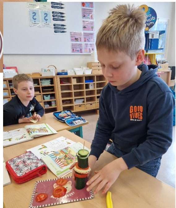
Text und Bilder: S. Senn